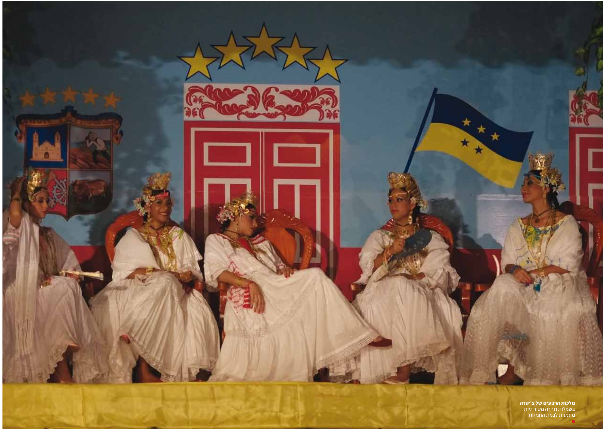
מלכות הרבעים של צ'יטרה בשמלות תחרה מסורתיות מחזמות לבמת החגיגות