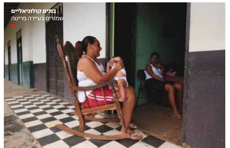
בתים קולוניאליים שמורים בעיירה פריטה