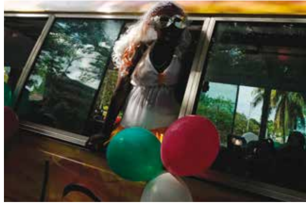
למעלה: צופה בקרנבל הבינלאומי בעיר ויקטוריה משתתפת בשמחה; למטה: אורח הכבוד של הקרנבל, מלך גאנה אוטומפו אוסיי טוטו השני

הנכסים העיקריים של 115 איי סיישל הם יופיים הטבעי - והשלווה. השלווה הזאת מופרת בשנים האחרונות מדי חודש אפריל על ידי קרנבל רועש וגועש. אין זה פסטיבל דתי או מסורת מקומית מושרשת אלא אירוע יזום, המושך אלפי משתתפים וצופים מרחבי העולם. בתום הקרנבל התושבים שבים לחיי השגרה, והתיירים יכולים לשוב אל החופים הלבנים ולהמשיך לבהות בשמש השוקעת במימי האוקיינוס ההודי.