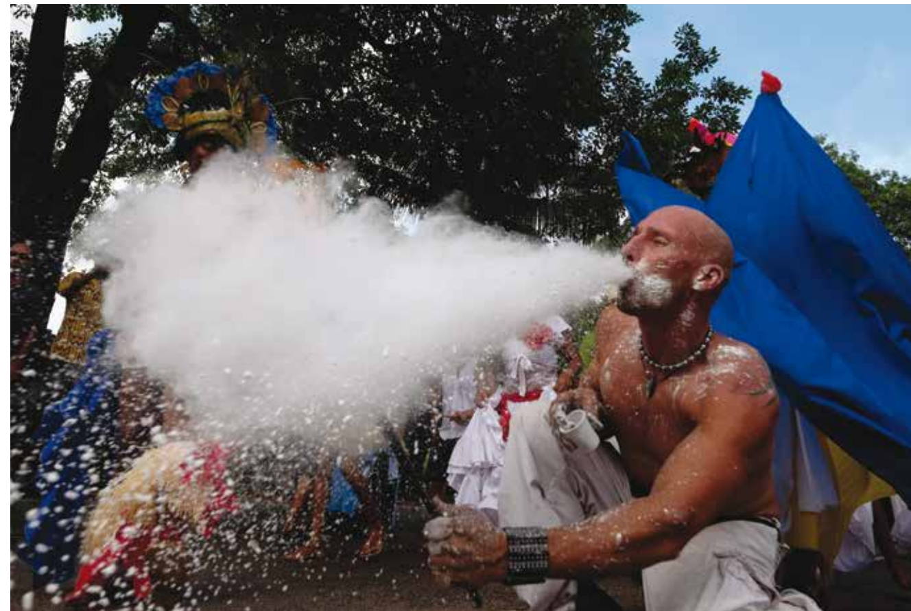
למעלה: עשן וקצף נפליטים מפיו של אחד ממשותפי התהלוכה; למטה: מבט מהחוף של האי פראלין אל מי הטורקיז של האוקיינוס ההודי