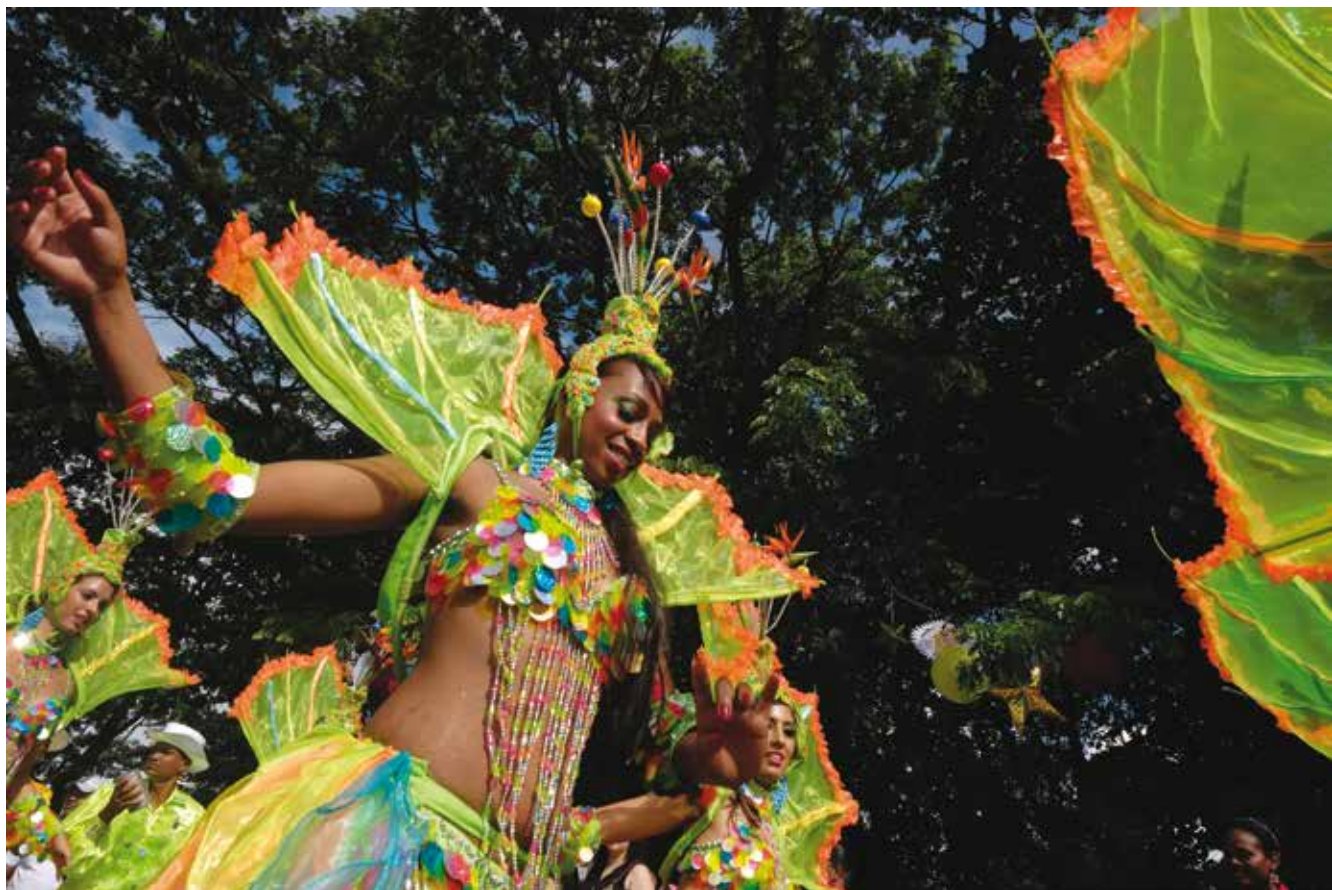
למעלה: רקדניות המשלחת מהאי השכן מאוריציט; למטה: הרחק מהמולת הקרבנל - דוכן אוכל בשוק הלילה של ויקטוריה