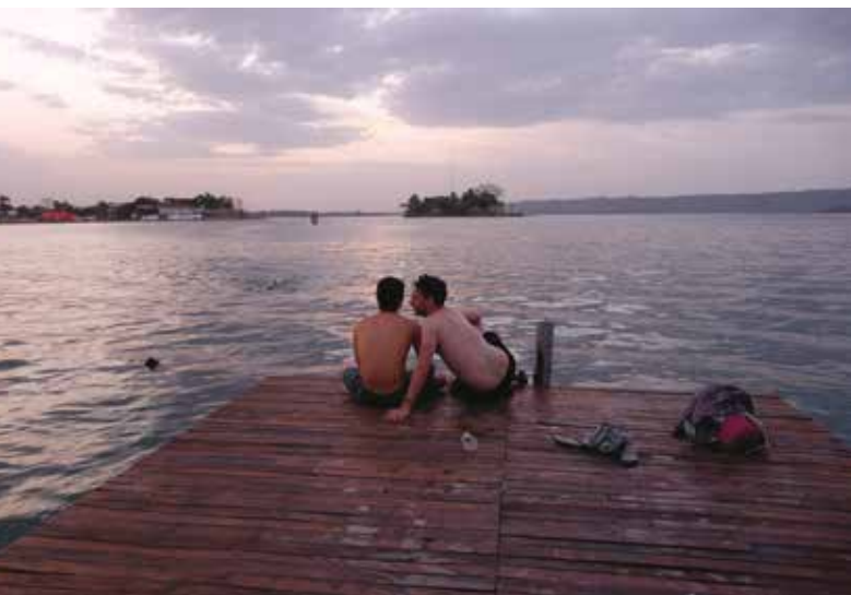
מכתש אסול, אתר של סלעי אבן גיר שנצבעו בטורקיז; שלט מזהיר מפני תנינים ליד מלון לאס לגונס; רוחצים על גדת האגם פטן איצה בפלורס; בעמוד ממול: טייל נח על ערסל במחנה הלילה של אתר אל מירדור במעבה הג'ונגל

אנחנו מטפסים על אל טיגרה (El Tigre), הפירמידה הראשונה שהתגלית תה באתר, שגובהה 55 מטרים. באקרופוליס המרכזי נמצא אפריו סטוקן באורך שמונה מטרים, שמתאר סצנה מתוך סיפור בריאת המאיה, הפופול ווך. חשיפת האפריו ב-2009 הייתה גילוי מרעיש, שכן הוכח כי כתיבת הפופול ווך לא הושפעה מהספרדים, כפי שנטען עד אז.